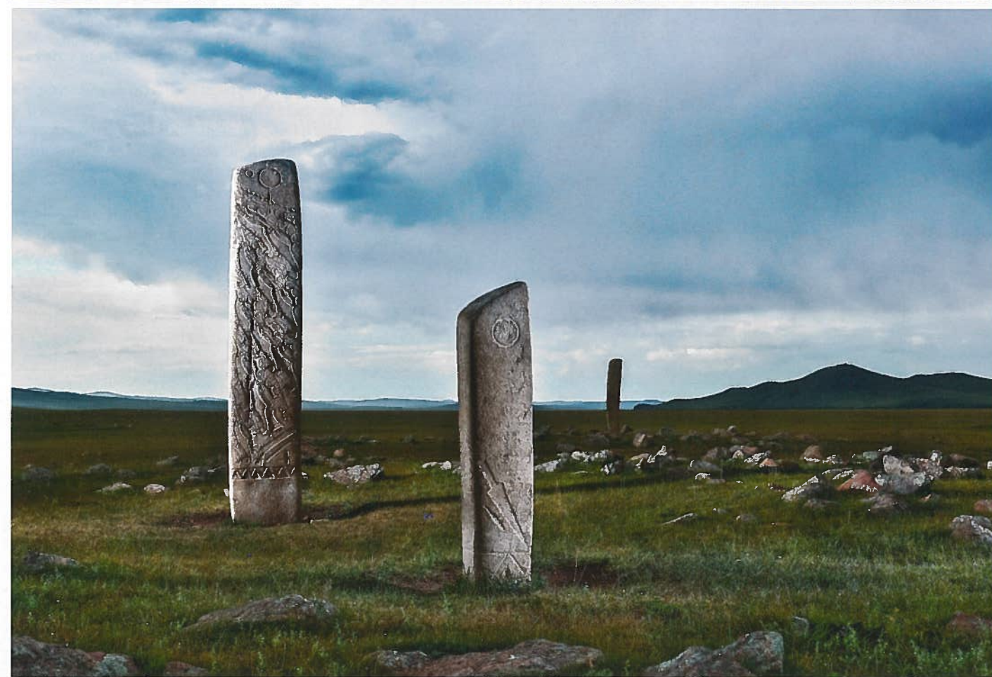
Sur les stèles, les cervidés, censés faciliter le passage des défunts vers l'au-delà, voisinent avec le soleil, la lune, et l'attirail guerrier (arc, bouclier, poignard, hache...) de ces farouches combattants des steppes.