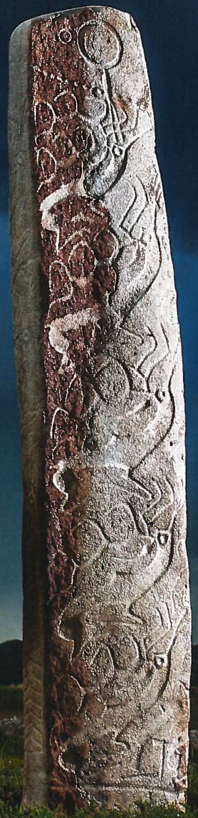
Les sites archéologiques de Tsatsyn Ereg et de Jargalant, à cinq cents kilomètres de la capitale, Oulan-Bator, comptent des centaines de pierres gravées datant de l'âge du bronze.

PAR NICOLAS ANCELLIN (TEXTE) ET JULIEN FAURE (PHOTOS)